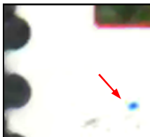
Michel-Nr 2472 Klatschmohn - Plattenfehler Blauer Fleck unter der linken unteren Bildecke