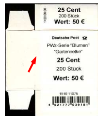
Type IV: Aufdruck "PWz-Serie Blumen" Blumenname normal gedruckt