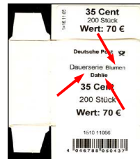
Type IIb: Aufdruck "Dauer- serie Blumen", Wort "Blumen" kleiner als Wort "Dauerserie" Blumenname fett gedruckt