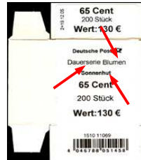
Type IIa: Aufdruck "Dauer- serie Blumen", Wort "Blumen" gleiche Größe wie "Dauerserie" Blumenname fett gedruckt