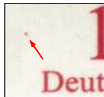
Michel-Nr 2484 Tulpe - Plattenfehler roter Fleck links neben der Wertziffer