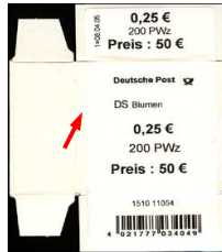
Type I: Aufdruck "DS Blumen"